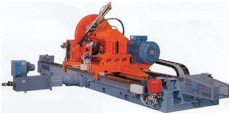
Kalt- oder Warmkreissäge TCC 120