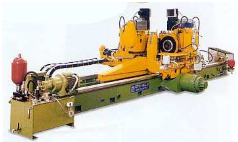
Kaltkreissäge mit Doppelsägeeinheit