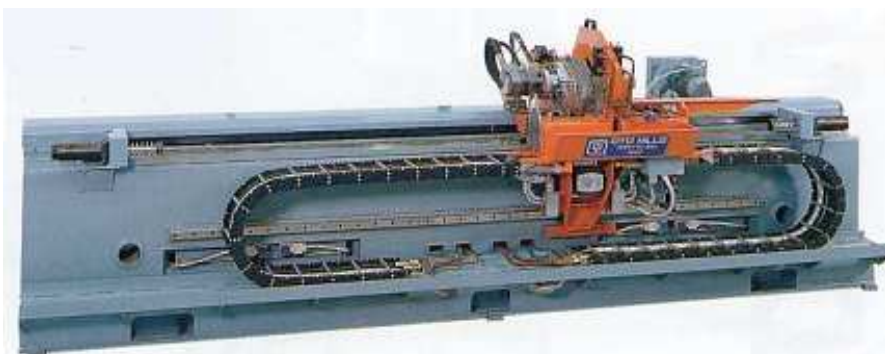
Kaltkreissäge TCGM 200